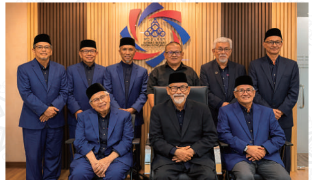
AHLI LEMBAGA PEMEGANG AMANAH & KETUA PEGAWAI EKSEKUTIF